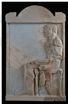
Το ανάγλυφο του κεραμέα. 1ος όροφος, Ακρ. 1332

Στη φωτιά που μεταμόρφωνε τον ταπεινό πηλό σε χρηστικά αντικείμενα και σε πανέμορφα έργα τέχνης όφειλε σε μεγάλο βαθμό την οικονομική της ανάπτυξη η Αθήνα του 6ου αι. π.Χ. Τα αττικά αγγεία κατέκλυζαν τις αγορές της Μεσογείου φέρνοντας μεγάλα κέρδη στους κεραμείς, οι οποίοι έδειχναν την ευγνωμοσύνη τους στη μεγάλη θεά της Ακρόπολης αφιερώνοντάς της πανάκριβα δώρα.