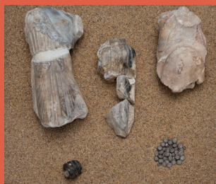
Γλυπτά και νομίσματα με τα ίχνη της φωτιάς των Περσών. 1ος όροφος, προθήκη 8.

Η φωτιά από δύναμη δημιουργίας μπορεί να μετατραπεί σε αιτία ολοκληρωτικής καταστροφής. Μια τέτοια καταστροφή αποτυπώθηκε με τον πιο βίαιο τρόπο στην Αθήνα του 480 π.Χ., όταν οι Πέρσες πυρπόλησαν την Ακρόπολη μετατρέποντας σε συντρίμια ναούς και αγάλματα.