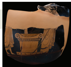
Θεούσα στην Αθηνά σε βωμό με κλαδιά. 1ος όροφος, προθήκη 29 αρ. 3.

Η εξαγινιστική δύναμη της φωτιάς γίνεται το μέσο επικοινωνίας με το θείο. Κάιει στους βωμούς και στέλνει στους θεούς το μήνυμα ευσεβείας του ανθρώπου καθώς η μυρωδιά από τα κομμάτια του θυσιασμένου ζώου, των καρπών, του κρασιού και των αρωματικών προσαναμμάτων ανεβαίνει στα ουράνια.