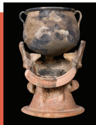
Φορητή εστία και χύτρα. Ισόγειο, προθήκη 3 αρ. 70-71.

Η φωτιά στάθηκε ο πυρήνας κοινωνικοποίησης του ατόμου. Το φως και η ζεστασιά της συγκέντρωναν γύρω της την ομάδα προωθώντας τη σκέψη και τον λόγο. Στη φλόγα της μαγειρευόταν το φαγητό και η θέση που άναβε, η εστία, έγινε συνώνυμο του σπιτιού και της οικογένειας που προστάτευε η ομώνυμη θεά, η Εστία.