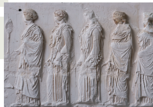
Ο λίθος VIII της ανατολικής ζωφόρου. 3ος όροφος, αίθουσα Παρθενώνα.

Στη ζωφόρο του Παρθενώνα τα ζώα οδηγούνται στο βωμό της Αθηνάς Πολιάδος για τη μεγάλη θυσία της γιορτής των Παναθηναίων. Νεαρές κοπέλες μεταφέρουν σκεύη για τις σπονδές και θυμιατήρια για το κάψιμο μύρου και λιβανιού. Η ιερή φωτιά για το άναμμα του βωμού είχε μεταφερθεί τα χαράματα με λαμπαδηδρομία από τον βωμό του Προμηθέα στην Ακαδημία.