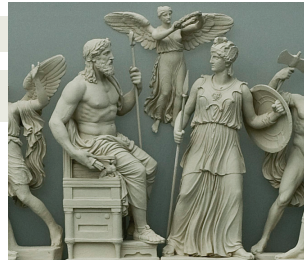
Ο κεραυνός στο χέρι του Δία. Αναπαράσταση ανατολικού αετώματος. 3ος όροφος, αίθριο αίθουσας Παρθενώνα.

Ο αρχαίος άνθρωπος παρακολουθεί με δέος, απορία και φόβο τη φωτιά που εκδηλώνεται ελεύθερα στη φύση. Στην πτώση ενός κεραυνού βλέπει το σημάδι του Δία, στην έκρηξη ενός ηφαιστείου τη χθόνια δύναμη του Ηφαίστου. Ο μύθος θέλει τον Προμηθέα να κλέβει τη θεϊκή γνώση για να την προσφέρει δώρο ζωής στο γένος των ανθρώπων.