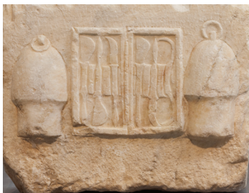
Καστίνα με χειρουργικά εργαλεία και βεντούζες. Ισόγειο, ιερό Ασκληπιού, αρ. ΕΑΜ 1378.

Η φωτιά συνέβαλε στην υγιεινή, τη θεραπεία και την ίαση. Ζέστανε το νερό για το λουτρό, απολύμναινε τα χειρουργικά εργαλεία, καυτηρίαζε τα τραύματα. Με την ανάφλεξη της δημιουργούσε το κενό στο εσωτερικό της βεντούζας που της επέτρεπε να προσκολληθεί στο δέρμα και να ελευθερώσει το σώμα από τους παθογόνους παράγοντες.