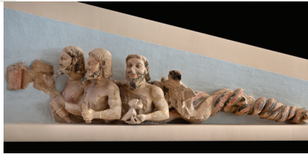
Ο «τρισώματος δαίμονας». 1ος όροφος, αίθουσα αρχαϊκής Ακρόπολης.

Το νερό, η φωτιά και ο αέρας δηλώνονται αλληγορικά με τον κυματισμό, τον κεραυνό και το πουλί που κρατά στα χέρια. Το τέταρτο, το χώμα, συμβολίζεται με το φιδίσιο σώμα του παράξενου όντος που κοσμούσε το αέτωμα του Εκατομπέδου.