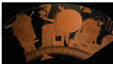
Παράσταση εργαστηρίων κεραμικής και μεταλλοτεχνίας. 1ος όροφος, προθήκη 29 αρ. 2.

Η φωτιά υπήρξε γενεσιουργός αιτία όλων των υλικών επιτευγμάτων του ανθρώπου. Πυροδοτώντας τον κλίβανο του κεραμέα ή το καμίνι του μεταλλουργού γινόταν φορέας προόδου, μοχλός ανάπτυξης τεχνών και τεχνικών.