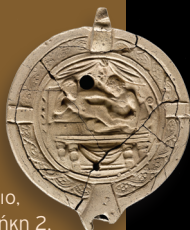
Ισόγειο, προθήκη 2, αρ. 47