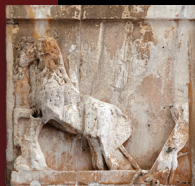
Μετόπη 14, αίθουσα Παρθενώνα