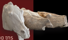
Το άρμα της Σελήνης