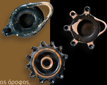
1ος όροφος, προθήκη 32, αρ. 9, 12, 10