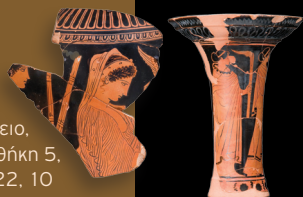
Ισόγειο, προθήκη 5, αρ. 22, 10

Τα πιο διαδεδομένα μέσα τεχνητού φωτισμού ήταν τα λυχνάρια. Κατασκευασμένα σε διάφορα σχήματα, μεγέθη και υλικά φωτιζαν σπίτια, καταστήματα, εργαστήρια και δημόσιους χώρους. Ήταν απαραίτητα στις θρησκευτικές γιορτές, τις νυχτερινές ιεροτελεσιές και τις νεκρικές τελετές ενώ αποτελούσαν συχνά αφιερώματα σε τάφους θνητών και σε ιερά θεών.