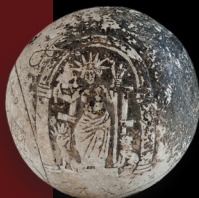
Μαρμάρινη σφαίρα, 1ος όροφος

Για τους αρχαίους Έλληνες ο θεός Ήλιος ήταν η προσωποποίηση του ηλιακού φωτός. Τον φαντάζονταν σαν ένα νέο ντυμένο με ρούχα φτιαγμένα από φως και αστραφτερό φωτοστέφανο στο κεφάλι, που οδηγούσε στον ουρανό το πύρινο άρμα του και επέβλεπε τα πάντα από ψηλά. Η παρουσία του, όπως και της αδελφής του Σελήνης, στις συλλογές του Μουσείου Ακρόπολης είναι έντονη.