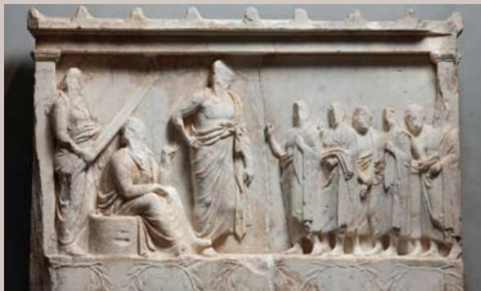
Εικ. 2 ΕΑΜ 1332, Αναθηματικό ανάγλυφο με αναπαράσταση του Ασκληπιού, της Δήμητρας και της Κόρης (Περσεφόνη), που δέχονται λατρευτές. Β' μισό 4ου αι. π.Χ.