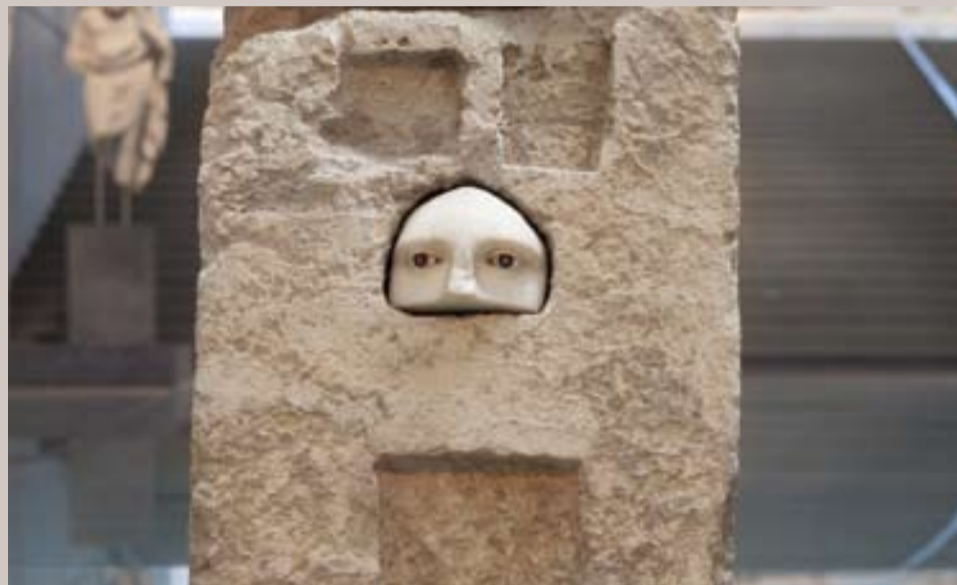
Εικ. 4 ΕΑΜ 15244, Τμήμα γυναικείου προσώπου, αφιέρωμα του Πραξία στον Ασκληπιό. Β' μισό 4ου αι. π.Χ.