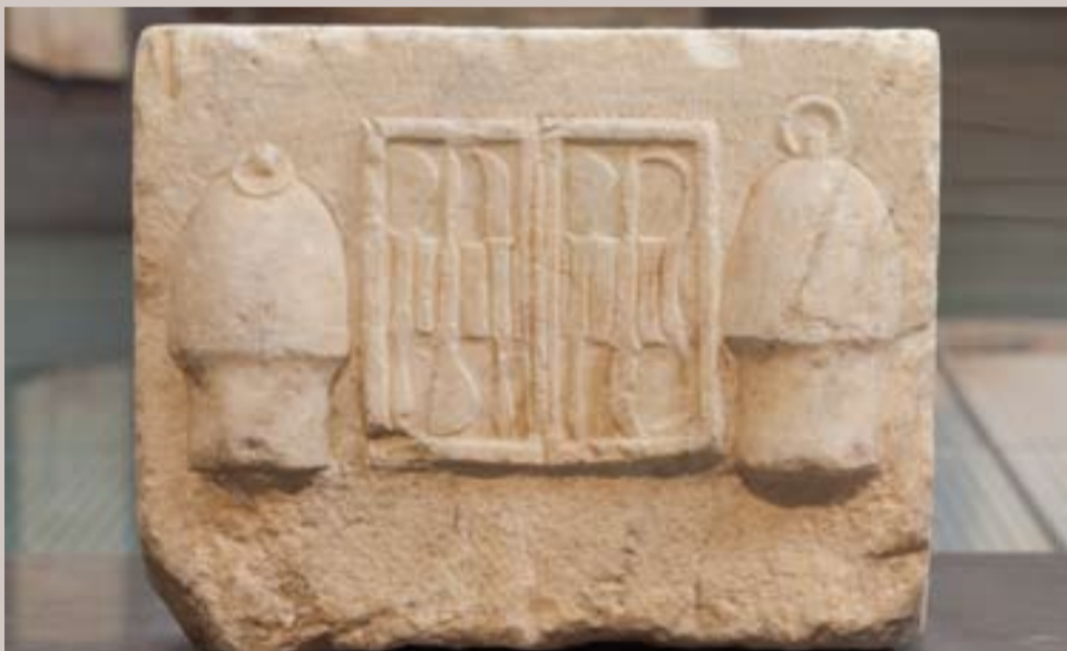
Εικ. 3 ΕΑΜ 1378, Βάση αναθήματος με ανάγλυφα χειρουργικά εργαλεία και βεντούζες (σικύες). 320 π.Χ.