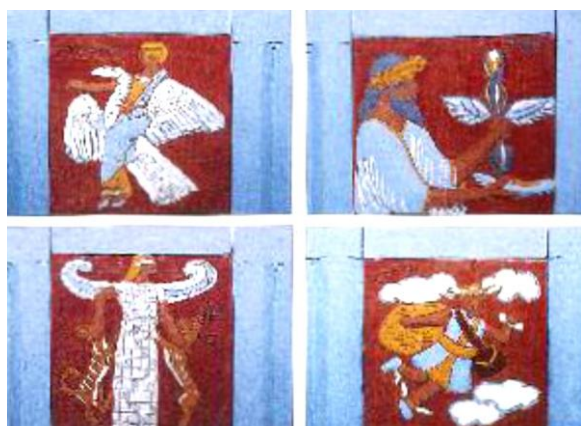
Έργο μαθητή από το 53ο Γυμνάσιο Αθηνών